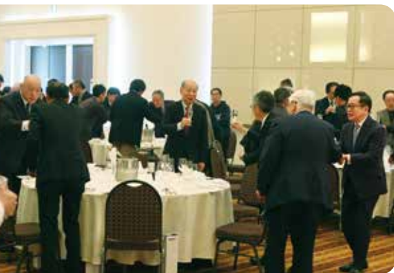
写真:上から／乾杯の風景 ／松田醸造責任者と高島地区契約農家の方々 ／高島ワイナリー役員全員で皆様を迎賓