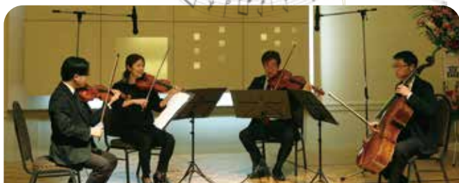
山形交響楽団四重奏