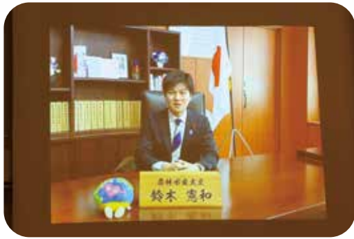
【ビデオメッセージ】 農林水産大臣 鈴木憲和様