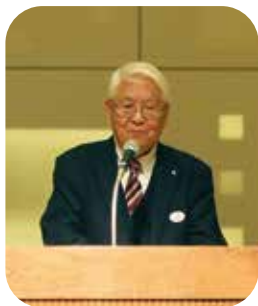
高島町長 高梨忠博様